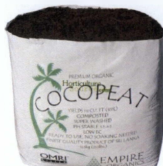
Εικόνα 3.7: Σάκος καλλιέργειας κοκοφοίνικα.

Στην δεύτερη περίπτωση το υπόστρωμα χρειάζεται ξεπλύμα για δύο ώρες περίπου με διάλυμα \text{CaNO}_3 , ενώ το ξεπλυμένο cocosoil έχει χαμηλή E.C. το οποίο όμως δεν είναι σταθεροποιημένο αφού έχει ξεπλυθεί με σκέτο νερό.