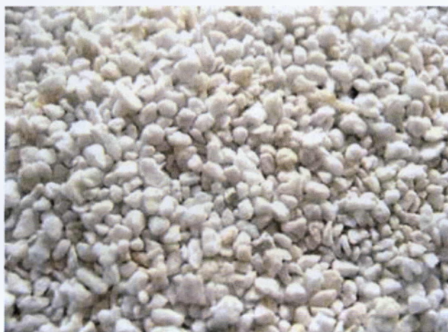
Εικόνα 3.1: Ο περλίτης στην εμπορική του μορφή

Για να ξεπεραστεί το πρώτο πρόβλημα, πρέπει να υγρανθεί ο περλίτης με νερό προτού χρησιμοποιηθεί.