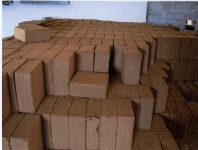
Εικόνα 3.6: Cocosoil σε μορφή τούβλων (Blocks).

Ο κοκοφοίνικας είναι ένα υλικό με πολλά προτερήματα σε σχέση με άλλα υποστρώματα. Είναι απαλλαγμένο από βακτήρια και από τα περισσότερα σπόρια μυκήτων, και η παραγωγή του δεν βλάπτει το περιβάλλον. Έχει υψηλή περιεκτικότητα σε κυτταρίνη και λιγνίνη, διατηρώντας έτσι τα φυσικά του χαρακτηριστικά για μεγάλο σχετικά χρονικό διάστημα.