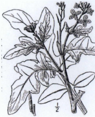
Εικόνα 1.1: Σκίτσο του φυτού της ήμερης ρόκας Eruca vesicaria

Έχει λευκόχρωμα άνθη με πορφυρές φλέβες και κίτρινους στήμονες. (Εικόνα 1.2) Τα σέπαλα πέφτουν αμέσως μετά το άνοιγμα των λουλουδιών. Ο καρπός έχει μέγεθος 12-35 χιλιοστά, κωνικός, ραμφοειδής και περιέχει αρκετά σπέρματα κίτρινου χρώματος (τα οποία είναι εδώδιμα). Η ρίζα του φυτού είναι πασσαλώδης. Πολλαπλασιάζεται με σπόρο. Η Eruca vesicaria έχει έναν αριθμό χρωμοσωμάτων 2n=22 .