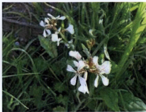
Εικόνα 1.2: Το φυτό της ήμερης ρόκας με το άνθος του

Έχει λευκόχρωμα άνθη με πορφυρές φλέβες και κίτρινους στήμονες. (Εικόνα 1.2) Τα σέπαλα πέφτουν αμέσως μετά το άνοιγμα των λουλουδιών. Ο καρπός έχει μέγεθος 12-35 χιλιοστά, κωνικός, ραμφοειδής και περιέχει αρκετά σπέρματα κίτρινου χρώματος (τα οποία είναι εδώδιμα). Η ρίζα του φυτού είναι πασσαλώδης. Πολλαπλασιάζεται με σπόρο. Η Eruca vesicaria έχει έναν αριθμό χρωμοσωμάτων 2n=22 .