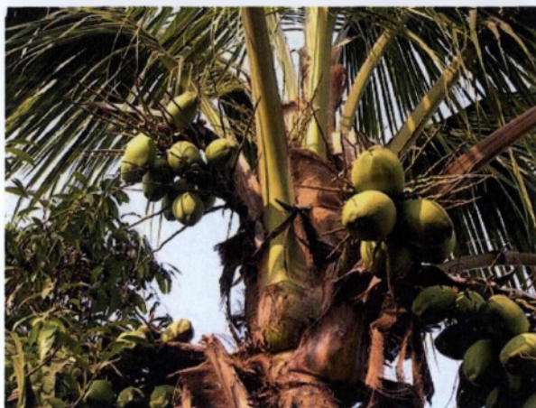
Εικόνα 3.5: Το φυτό κοκοφοίνικας.

Ο κοκοφοίνικας είναι ένα υλικό οργανικής προέλευσης με πολύ καλά χαρακτηριστικά σχετικά με την υδατοϊκανότητα, την αεροϊκανότητα κ.α.. Παράγεται μετά από επεξεργασία της καρύδας.