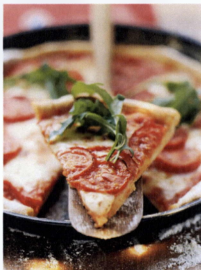
Εικόνα 1.3: Πίτσα με φύλλα ρόκας

Στην Ιταλία η ρόκα χρησιμοποιείται συχνά σε πίτσες, προσθέτοντάς την λίγο πριν το τέλος του ψησίματος, ή αμέσως μετά, έτσι ώστε να μην μαραίνεται μέσα στην ζέστη (Εικόνα 1.3).