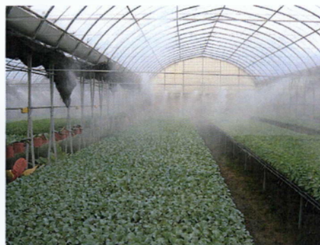
Εικόνα 1.5: Σύστημα άρδευσης με καταιονισμό

Στην περίπτωση της άρδευσης με καταιονισμό (Εικόνα 1.5), η αυξημένη ταχύτητα πρόσπτωσης των σταγόνων της τεχνητής βροχής στα φύλλα μπορεί να καταστρέφει το φύλλο υποβαθμίζοντας την παραγωγή. Το σύστημα άρδευσης το οποίο χρησιμοποιείται περισσότερο στην καλλιέργεια ήμερης ρόκας, είναι αυτό του καταιονισμού με καταιονιστήρες μέσης παροχής (120L/h) και ακτίνας διαβροχής (3-5m).