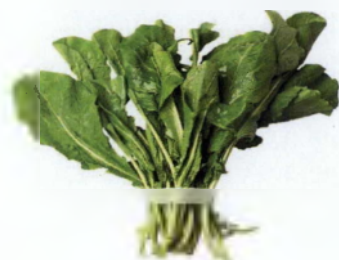
Εικόνα 1.6: Φύλλα ρόκας σε ματσάκι.

συγκομιδή της. Για μικρότερο χρονικό διάστημα, τα φύλλα συσκευάζονται και διατηρούνται σε θερμοκρασία 4-6°C και σχετική υγρασία 60-70%. (S. Padulosi & D. Pignone, 1996)