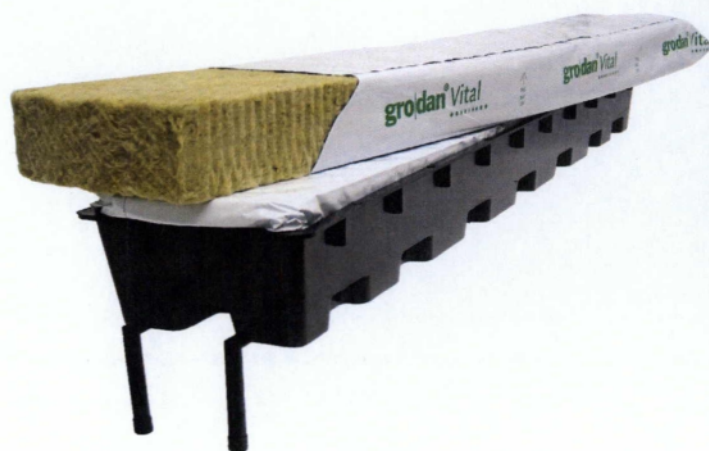
Εικόνα 8.2: Δείγμα από πλάκες πετροβάμβακα.

Χρησιμοποιούνται επίσης και οι κόκκοι από πετροβάμβακα. Αυτοί συνήθως αναμιγνύονται με άλλα μέσα, όπως μείγματα τύπου τυρφίτη, για τη μετατροπή της ικανότητας συγκράτησης νερού και της ισορροπίας αέρα-νερού.