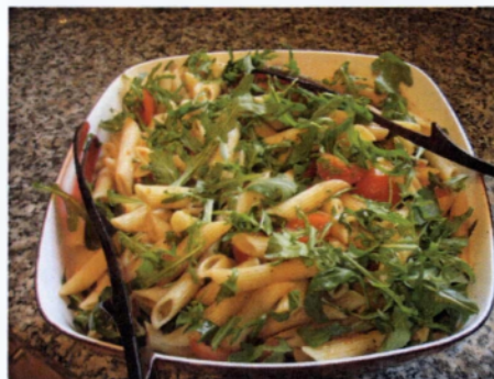
Εικόνα 1.4: Σαλάτα με πένες και φύλλα ρόκας

Η ρόκα είναι μια καλλιέργεια με συνεχή αύξηση, τόσο όσον αφορά στην έκταση, όσο και στην παραγωγή του σε όλη την Ελλάδα. Αυτό συμβαίνει κυρίως λόγω της διάχυσης των έτοιμων προς χρήση σαλατών, που επεκτείνουν τη διάρκεια ζωής της ρόκας και τη διατήρηση της φρεσκάδας της και του χαρακτηριστικού αρώματός της (Εικόνα 1.4).