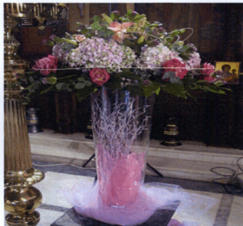
Εικόνα 3.2 Ανθοστήλες γάμων