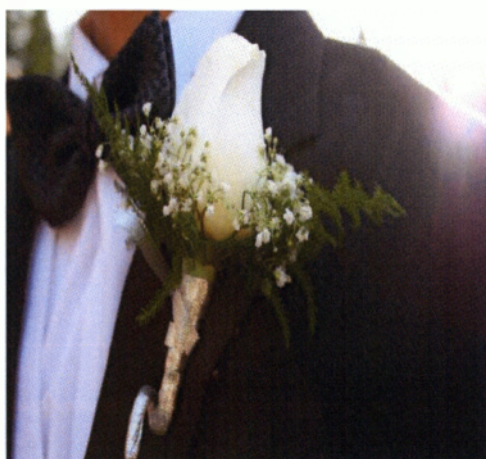
Εικόνα 3.32 Μπουτονιέρα

Οι μπουτονιέρες μπορούμε να πούμε ότι είναι μικρά κορσάζ και στην απλούστερή τους μορφή μπορεί να αποτελούνται από ένα μόνο λουλούδι. Ο προορισμός τους είναι να στολίζουν το πέτο του γαμπρού, του κουμπάρου, αλλά και τα πέτα των συγγενών των νεόνυμφων (πατέρες, αδερφοί). Μια μικρή αλλά σημαντική συμβουλή είναι τα κορσάζ και οι μπουτονιέρες να είναι φτιαγμένα από τα ίδια είδη λουλουδιών που θα γίνει το νυφικό μπουκέτο και ο υπόλοιπος στολισμός. Οποσδήποτε εκείνη την μέρα όλα πρέπει να είναι αρμονικά.