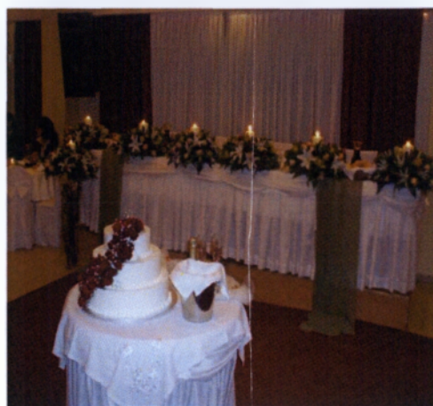
Εικόνα 3.38 Στολισμός τραπεζιού νεόνυμφων

Διακόσμηση τραπεζιών καλεσμένων: Τα τραπέζια των καλεσμένων πρέπει να είναι πολύ προσεγμένα και όχι πολύ γεμάτα. Εκεί συνήθως ο ανθοδέτης ή ο διακοσμητής χρησιμοποιεί ίσως μικρές συνθέσεις ή γυάλινα δοχεία με κεριά μέσα και διάφορα αξεσουάρ συνδυασμένα με υφάσματα ώστε όλος ο στολισμός να έχει το ίδιο μοτίβο.