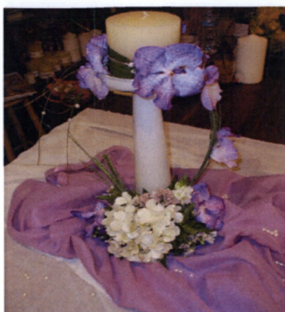
Εικόνα 3.39 Στολισμός τραπεζιού καλεσμένων

Διακόσμηση τραπεζιών καλεσμένων: Τα τραπέζια των καλεσμένων πρέπει να είναι πολύ προσεγμένα και όχι πολύ γεμάτα. Εκεί συνήθως ο ανθοδέτης ή ο διακοσμητής χρησιμοποιεί ίσως μικρές συνθέσεις ή γυάλινα δοχεία με κεριά μέσα και διάφορα αξεσουάρ συνδυασμένα με υφάσματα ώστε όλος ο στολισμός να έχει το ίδιο μοτίβο.