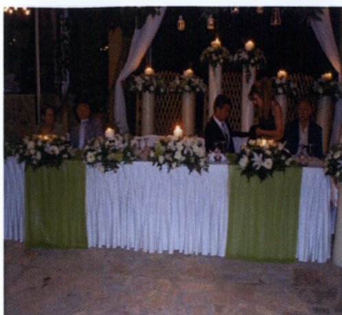
Εικόνα 3.37 Στολισμός τραπεζιού νεόνυμφων