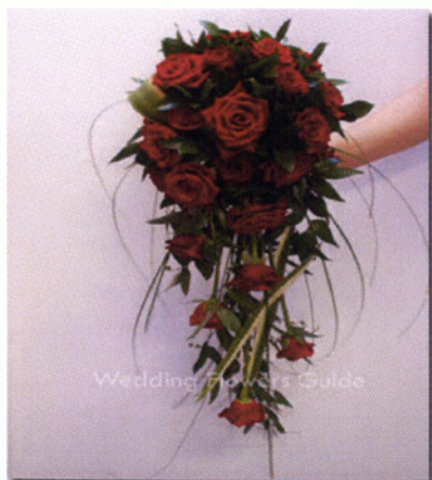
Εικόνα 3.21 Ανθοδέσμη σταγόνα