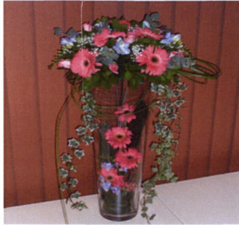
Εικόνα 5.2 Σύνθεση Fluid

πρέπει να ξεφεύγει έξω από αυτό. Για να πετύχουμε αυτό το αποτέλεσμα τα λουλούδια πρέπει να είναι τοποθετημένα το ένα κοντά στο άλλο, έτσι ώστε να δίνουν μία ρευστή εικόνα προς τα έξω. Η τεχνική αυτή είναι πιο αυστηρή σχηματικά με καθαρές άκρες και γωνίες χωρίς παράσιτα.