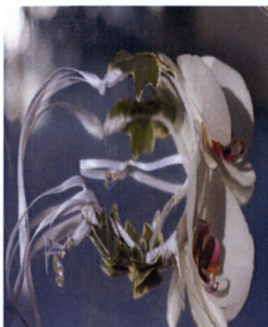
Εικόνα 3.33 Κουάφ

Κουάφ λέγεται η λουλουδένια κορώνα ή σύνθεση που συμπληρώνει το χτένισμα της νύφης. Η κουάφ είναι ίσως το μοναδικό σημείο που η τέχνη του ανθοδέτη πρέπει να συνδυαστεί με την τέχνη κάποιου άλλου, δηλαδή του κομμωτή ή της κομμώτριας. Βασικό αξεσουάρ για κάθε νύφη, που η επιλογή των λουλουδιών πρέπει να γίνει προσεκτικά.