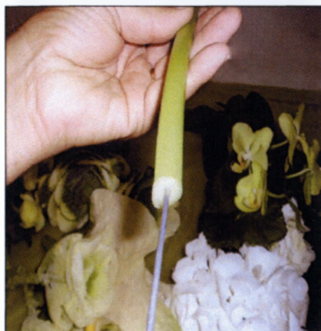
Εικόνα 2.11 Ενσυρμάτωση σε χοντρό μίσχο