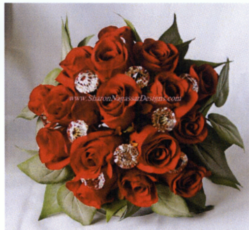
Εικόνα 3.18 Κυκλικό μπουκέτο