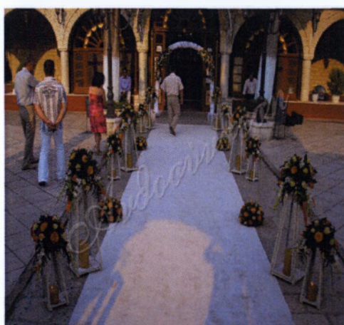
Εικόνα 3.12 Φαναράκια σε εξωτερικό στολισμό