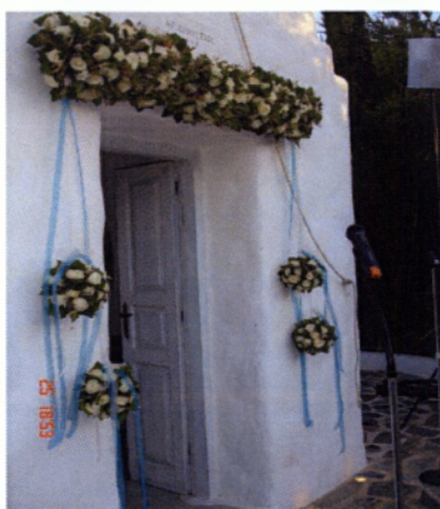
Εικόνα 4.13 Στολισμός γιρλάντας

Οι γιρλάντες τοποθετούνται στην καμάρα της κεντρικής εισόδου της εκκλησίας συνδυασμένες με φιόγκους από κορδέλες αλλά και με μπαλόνια. Για την κατασκευή της γιρλάντας έχει αναφερθεί εκτενέστερα παραπάνω στον στολισμό της κολυμπήθρας. Η γιρλάντα μπορεί να μην είναι απαραίτητη ωστόσο επιλέγεται συχνά για το εντυπωσιακό της αποτέλεσμα.