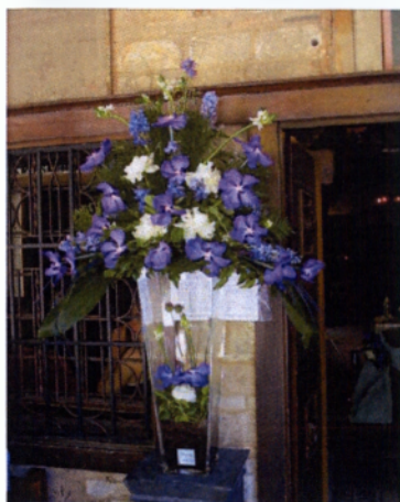
Εικόνα 4.6 Ανθοστήλες βάφτισης

Οι ανθοστήλες στη βάφτιση δεν είναι απαραίτητο να υπάρχουν, παρόλα αυτά τα τελευταία χρόνια πολλοί τις επιλέγουν, θέλοντας να καταφέρουν μια ονειρεμένη και πλούσια διακόσμηση. Οι ανθοστήλες κατασκευάζονται με τον ίδιο ακριβώς τρόπο όπως έχει αναφερθεί παραπάνω στο κεφάλαιο του γάμου. Η επιλογή των λουλουδιών πρέπει να εναρμονίζεται με το υπόλοιπο σύνολο και τα υλικά που θα χρησιμοποιηθούν να είναι κατάλληλα για την περίπτωση. Απαλοί χρωματισμοί, μικρές αντιθέσεις και ίσως κάποια παιδικά αξεσουάρ θα έδιναν μια ευχάριστη και επιθυμητή νότα στο στολισμό.