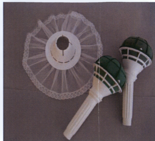
Εικόνα 2.8 Σφουγγάρι μικρόφωνο για νυφική ανθοδέσμη