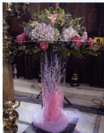
Εικόνα 4.7 Ανθοστήλες βάφτισης