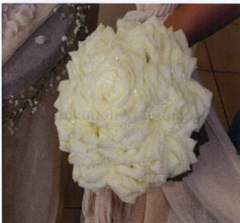
Εικόνα 3.4 Ανθοδέσμη σχήμα κλαμέλιας

Μια πρωτότυπη νυφική ανθοδέσμη που αποτελείται από πέταλα λουλουδιών δημιουργώντας ένα στρογγυλό σχήμα, δίνοντας την εντύπωση ενός τεράστιου λουλουδιού.