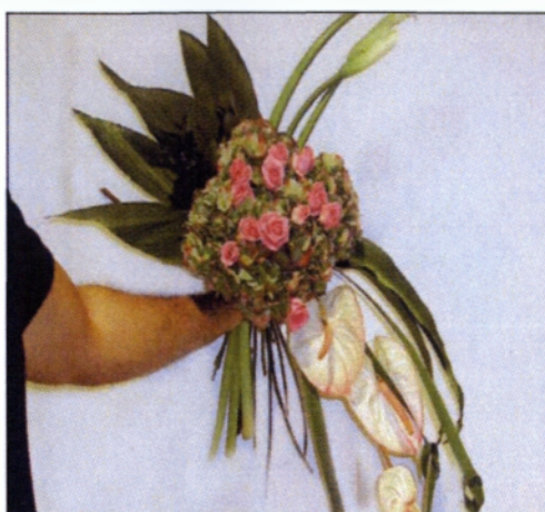
Εικόνα 5.7 Γραμμικό μπουκέτο

Το γραμμικό μπουκέτο μπορεί να κατασκευαστεί με τρία μόνο λουλούδια, ωστόσο μπορεί να γίνει και πολύ εντυπωσιακό με μεγαλύτερη ποικιλία και ειδικά αν χρησιμοποιηθούν διάφορα είδη φυλλωμάτων που στην περίπτωση αυτή, αυτά διευκολύνουν τις γραμμές στο μπουκέτο.