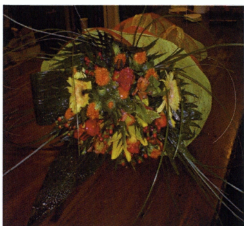
Εικόνα 5.4 Μπουκέτο

Υπάρχουν διάφοροι τρόποι κατασκευής ενός μπουκέτου είτε είναι απλό είναι νυφικό. Με τα νυφικά μπουκέτα θα ασχοληθούμε αναλυτικά στο κομμάτι του γάμου. Εδώ θα αναλύσουμε αρχικά το μπουκέτο “biedermeier”, δηλαδή το κλασικό μπουκέτο(Σταυρόπουλος Γ. και Π., 2007)