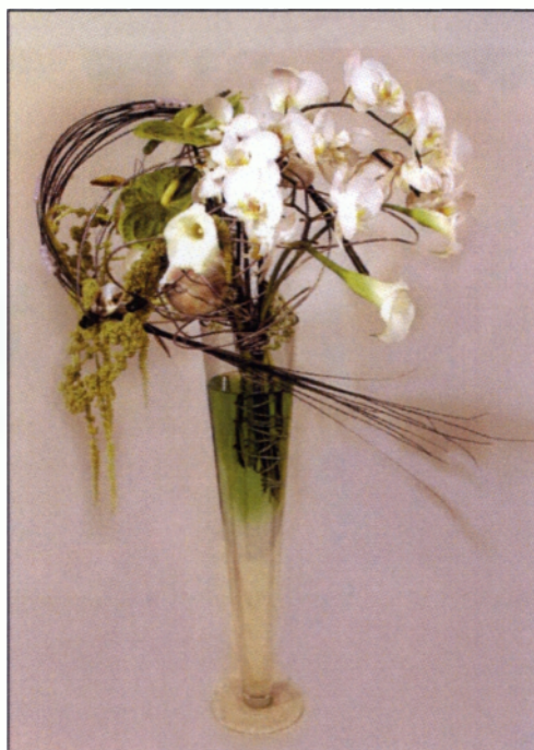
Εικόνα 5.8 Μπουκέτο σε πλαίσιο

Το μπουκέτο αυτό διαφέρει από τα άλλα είδη κατασκευαστικά και είναι αρκετά πιο πολύπλοκο και χρονοβόρο αλλά το αποτέλεσμα είναι πολύ πιο εντυπωσιακό. Το πλαίσιο μπορεί να διαφέρει σε υλικό, δηλαδή μπορεί να είναι από ξύλο, κλαδιά π.χ. λυγαριές, Salix και άλλα παρεμφερή ξυλώδους υφής, αλλά μπορεί να είναι και μεταλλικά όπως το αλουμινένιο σύρμα, το οποίο είναι σχετικά εύκαμπτο. Σε τέτοιου είδους μπουκέτο χρησιμοποιούνται συνήθως εντυπωσιακά λουλούδια με μακριούς μίσχους, διάφορα είδη φυλλαμάτων για να προσδιορίσουν τις γραμμές και αξεσουάρ ώστε το τελικό αποτέλεσμα να είναι διακοσμητικό(Σταυρόπουλος Γ. και Π., 2007).