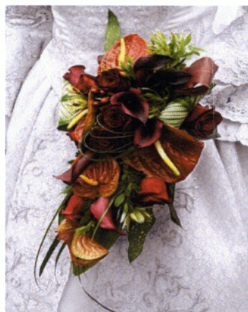
Εικόνα 3.27 Τοξοειδής ανθοδέσμη

Ένα αυστηρό αλλά παράλληλα μοντέρνο μπουκέτο που δημιουργείται από μεμονωμένα λουλούδια τοποθετημένα με συμμετρικό τρόπο.