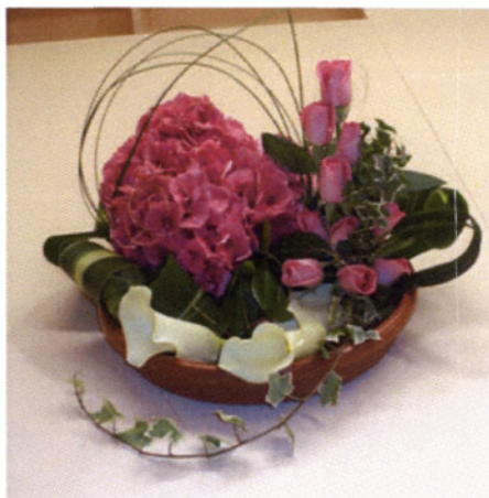
Εικόνα 6.7 Σύνθεση graphic