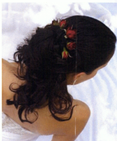
Εικόνα 3.34 Κουάφ

Μέρος του μυστηρίου αποτελούν και ο δίσκος, το ποτήρι και το μπουκάλι. Και αυτά θα πρέπει να ταιριάζουν με το στυλ του γάμου και τον στολισμό της εκκλησίας. Στον δίσκο, μπαίνουν τα στέφανα πριν χρησιμοποιηθούν και στολίζεται με τα ίδια λουλούδια του συνολικού στολισμού σε συνδυασμό με κουφέτα και κορδέλες. Από το ποτήρι πίνουν οι νεόνυμφοι το κρασί και είναι και αυτό στολισμένο κατά τον ίδιο τρόπο όπως επίσης και το μπουκάλι. Τέλος, στολίζονται και τα κεράκια των κουμπάρων με ανάλογο τρόπο, τα οποία είναι τρία και τα κρατούν κατά τη διάρκεια του μυστηρίου( www.curlvhairsalon.com )