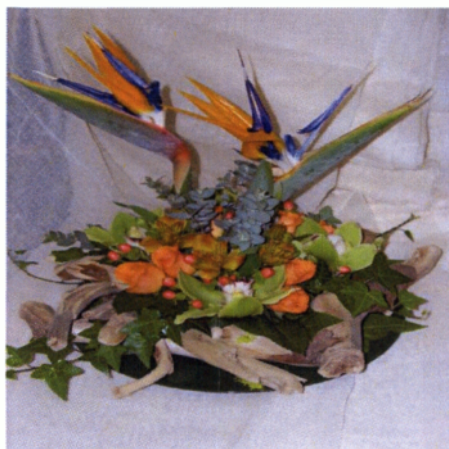
Εικόνα 6.6 Σύνθεση graphic

να φορτωθεί πολύ η σύνθεση γιατί στην προκειμένη περίπτωση «το λίγο είναι αρκετό»(Σταυρόπουλος Γ. και Π., 2007).