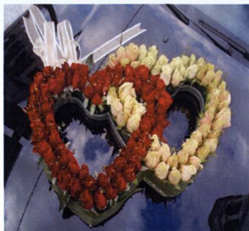
Εικόνα 3.36 Σύνθεση διπλής καρδιάς

Μια βασική λεπτομέρεια είναι ότι ο στολισμός δεν πρέπει να περιορίζει την ορατότητα του οδηγού γι' αυτό πρέπει να μελετηθεί προσεκτικά το μέγεθος και ο προσανατολισμός της μπροστινής σύνθεσης. Τοποθετείται δεξιά στην επιφάνεια του