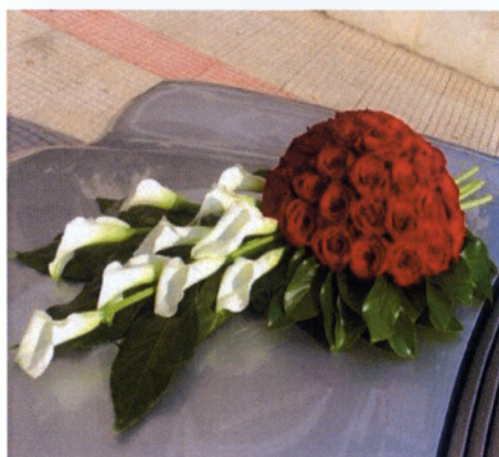
Εικόνα 3.35 Σύνθεση αυτοκινήτου

Τα υλικά ποικίλουν από ξυλοκορδέλες, οργάντζα, σατέν αλλά και τούλια. Οι φιόγκοι μπορεί να είναι μικροί και διακριτικοί ή μεγάλοι και εντυπωσιακοί ανάλογα με τον τύπο του στολισμού. Βέβαια επειδή τα αξεσουάρ είναι συμπληρωματικό στοιχείο στον στολισμό του αυτοκινήτου σε καμιά περίπτωση δεν θα πρέπει να χρησιμοποιούνται σε υπερβολική ποσότητα ώστε να υπερκαλύπτουν το κύριο θέμα του στολισμού που είναι τα λουλούδια.