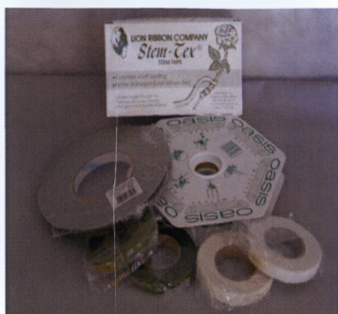
Εικόνα 2.2 Floraltapes