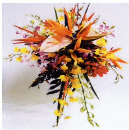
Εικόνα 6.1 Σύνθεση cascade

❖ Cascade (καταρρακτώδης-κρεμαστή): Η τεχνική αυτή απεικονίζει ένα φυσικό τοπίο, έναν καταρράκτη. Για να πετύχουμε αυτό το αποτέλεσμα χρησιμοποιούμε μικρά λουλούδια τα οποία τοποθετούνται σε σειρές η μία πάνω στην άλλη ώστε να δώσουμε την αίσθηση του υγρού στοιχείου που ρέει. Επίσης, σε τέτοιου είδους σύνθεση πρέπει να χρησιμοποιούνται πολλά και διάφορα είδη πρασινάδας για να μοιάζει με φυσικό καταρράκτη.