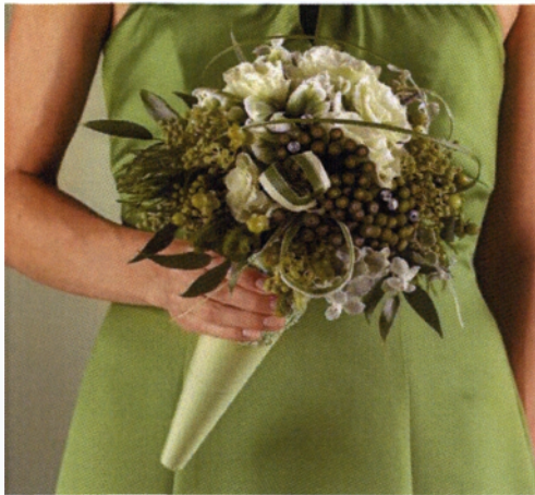
Εικόνα 3.19 Στρογγυλό-Δομημένο μπουκέτο

Ένα ενδιαφέρον στυλ που αποτελείται από διαφορετικά είδη λουλουδιών συγκεντρωμένα σε μεγάλες επιφάνειες. Εδώ, μπορούν να χρησιμοποιηθούν και άλλα διακοσμητικά στοιχεία όπως σύρμα και πέρλες που θα κάνουν το μπουκέτο ξεχωριστό.