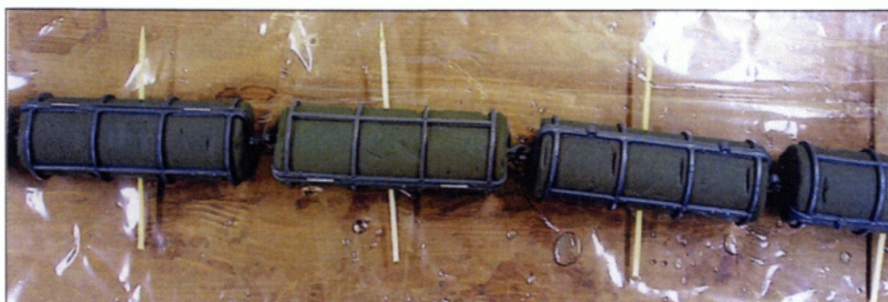
Εικόνα 4.1 Σφουγγάρι λουκάνικο