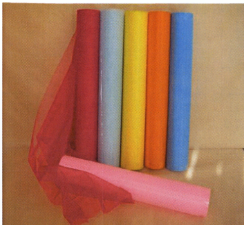
Εικόνα 2.9 Υφάσματα περιτυλίγματος