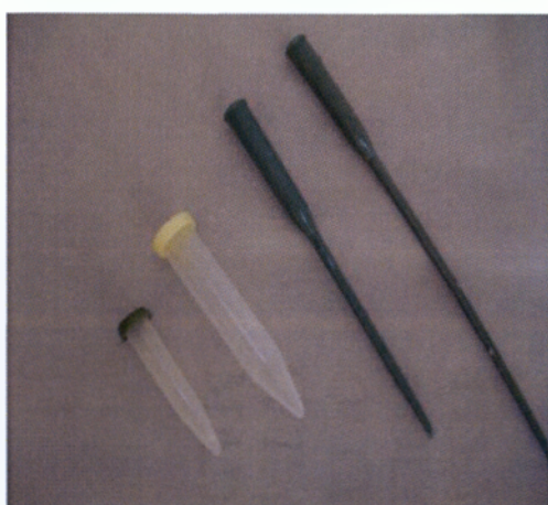
Εικόνα 2.5 Αμπούλες