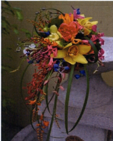
Εικόνα 3.29 Ανθοδέσμη σε ελεύθερο σχήμα

Μια ανθοδέσμη ελεύθερη, ασύμμετρη, που δεν ακολουθεί γραμμές και σχήματα. Κατάλληλη για ένα εκκεντρικό και πρωτότυπο γάμο.