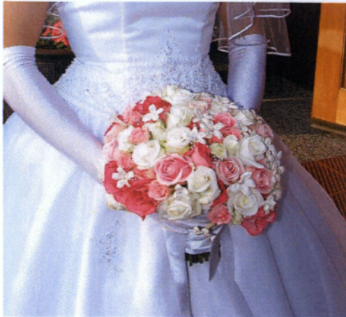
Εικόνα 3.15 Στρογγυλό-Συμμετρικό μπουκέτο