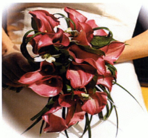
Εικόνα 3.28 Ανθοδέσμη καταρράκτης

Τα σχήματα και οι γραμμές παίζουν βασικό ρόλο στο συγκεκριμένο στυλ. Είναι μια εκκεντρική και μοντέρνα νυφική ανθοδέσμη.