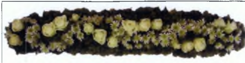
Εικόνα 4.2 Κατασκευή γιρλάντας