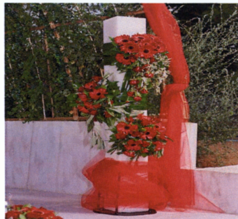
Εικόνα 3.6 Λαμπάδες γάμων