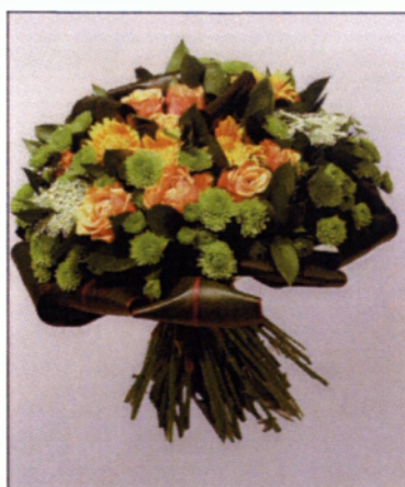
Εικόνα 5.6 Μπουκέτο Biedermeier