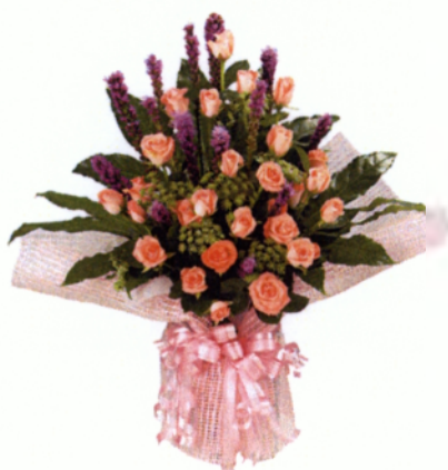
Εικόνα 5.2 Ανθοδέσμη