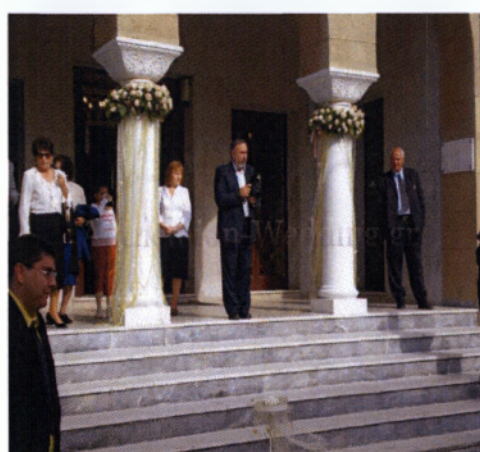
Εικόνα 3.10 Στολισμός κολώνας