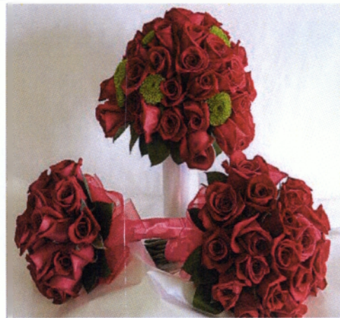
Εικόνα 3.20 Στρογγυλό-Δομημένο μπουκέτο