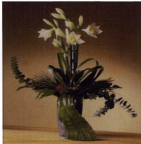
Εικόνα 6.5 Σύνθεση group

❖ Graphic (γραφική): Η τεχνική αυτή ονομάζεται γραφική επειδή ανήκει στον γραμμικό τρόπο σχηματισμού. Είναι η πιο συνηθισμένη τεχνική γιατί είναι εύκολη, απλή, κλασσική, αφηρημένη αλλά και η πιο παρεξηγημένη. Εδώ οι γραμμές πρέπει να είναι πολύ αυστηρές και τα λουλούδια όλα ευδιάκριτα. Δεν υπάρχει κανένας περιορισμός στην κατεύθυνση των γραμμών, ωστόσο δεν πρέπει