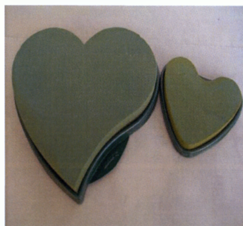
Εικόνα 2.4 Σφουγγάρι σε σχήμα καρδιάς για αυτοκίνητο