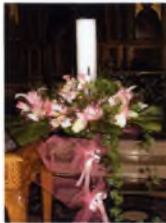
Εικόνα 4.5 Στολισμός λαμπάδας