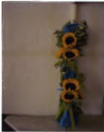
Εικόνα 4.4 Στολισμός λαμπάδας