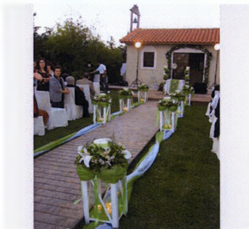
Εικόνα 3.11 Φαναράκια σε εξωτερικό στολισμό

Επίσης, στον εξωτερικό στολισμό της εκκλησίας μπορούν να χρησιμοποιηθούν και άλλα είδη διακόσμησης εκτός από τα φαναράκια. Μερικές προτάσεις είναι πιθάρια στολισμένα με λουλούδια και υφάσματα, γυάλινες βάσεις με ζελέ ή χρωματιστό νερό, στολισμένες με συνθέσεις, όπως τα κολωνάκια που έχουμε αναφέρει παραπάνω ή ακόμα γιρλάντες με διάφορα λουλούδια τοποθετημένες στην πύλη της εκκλησίας. Ότι και να επιλέξει κανείς για τον εξωτερικό στολισμό θα πρέπει σίγουρα να ταιριάζει με τον εσωτερικό και σε στυλ και χρωματικά για ένα ικανοποιητικό και εντυπωσιακό αισθητικό αποτέλεσμα( www.valentine.gr ).