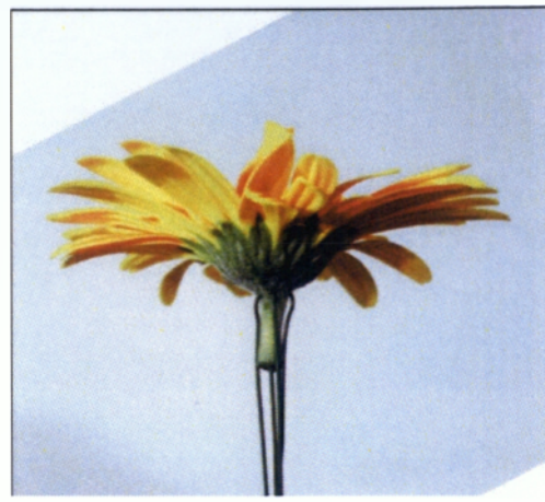
Εικόνα 2.14 Μέθοδος ενσυρμάτωσης σταυρού στη ζέρμπερα