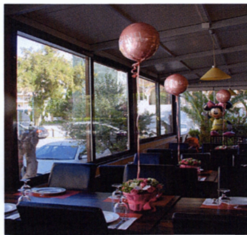
Εικόνα 4.16 Στολισμός τραπεζιών καλεσμένων