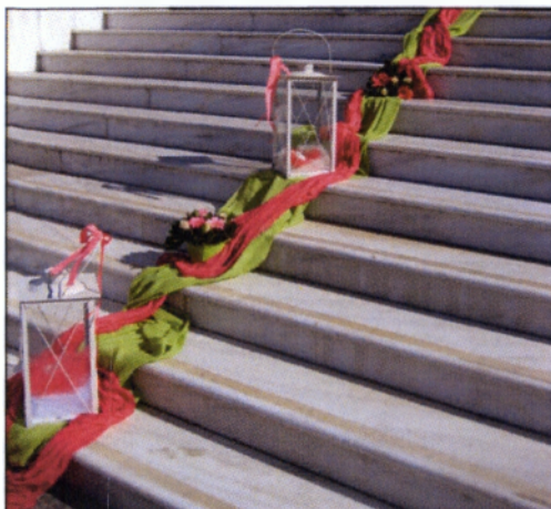
Εικόνα 4.11 Φαναράκια διαδρόμου

Τα φαναράκια τοποθετούνται στα σκαλιά της εκκλησίας δημιουργώντας έτσι ένα διάδρομο. Πάνω σε αυτά κατασκευάζονται μικρές συνθέσεις διαφόρων σχημάτων και μορφής έχοντας πάντα υπόψη την ομοιομορφία σε σχέση με το σύνολο.