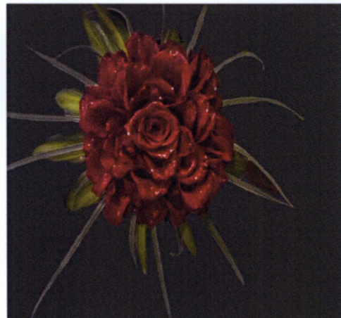
Εικόνα 3.26 Ανθοδέσμη σχήμα κλαμέλιας