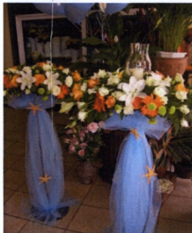
Εικόνα 4.9 Κολωνάκια βάφτισης