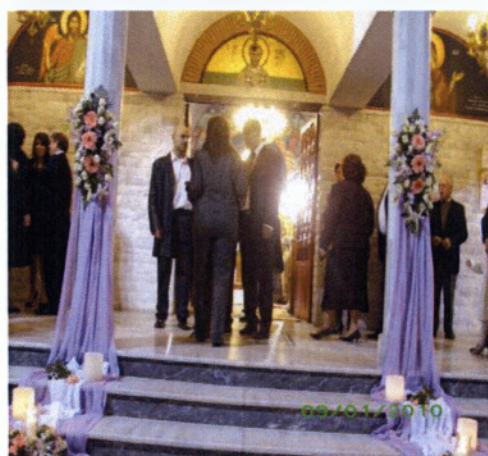
Εικόνα 3.9 Στολισμός κολώνας

Οι κολώνες χρησιμοποιούνται για τον εξωτερικό στολισμό της εκκλησίας και στολίζουν τις κολώνες της γι' αυτό και ονομάζονται έτσι. Τοποθετούνται δεξιά και αριστερά από την είσοδο της για μια θερμή υποδοχή. Πρέπει να είναι και αυτές εναρμονισμένες με το όλο σύνολο και κατασκευαστικά γίνονται με τον ίδιο τρόπο όπως οι μακρόστενες λαμπάδες. Συνήθως οι κολώνες της εκκλησίας μαζί με τις συνθέσεις διακοσμούνται και με ανάλογα υφάσματα για πιο εντυπωσιακό αποτέλεσμα.