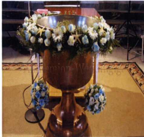
Εικόνα 4.3 Στολισμός κολυπήθρας