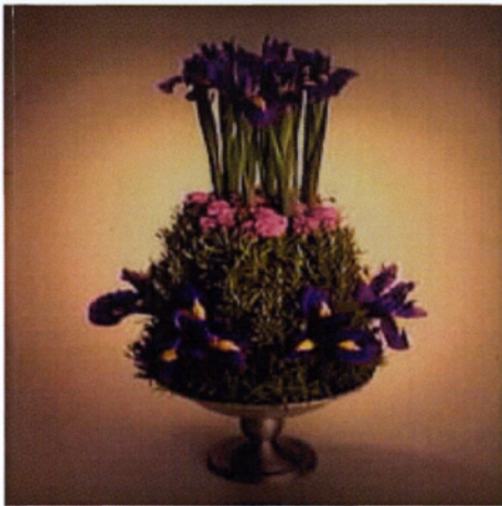
Εικόνα 6.4 Σύνθεση group

❖ Group (ομαδοποιημένη): Η τεχνική αυτή ονομάζεται ομαδοποιημένη επειδή τα λουλούδια που χρησιμοποιούνται είναι αποκλειστικά σε ομάδες. Σε αυτή την τεχνική δίνεται ιδιαίτερη έμφαση στο σχήμα και το χρώμα των λουλουδιών.