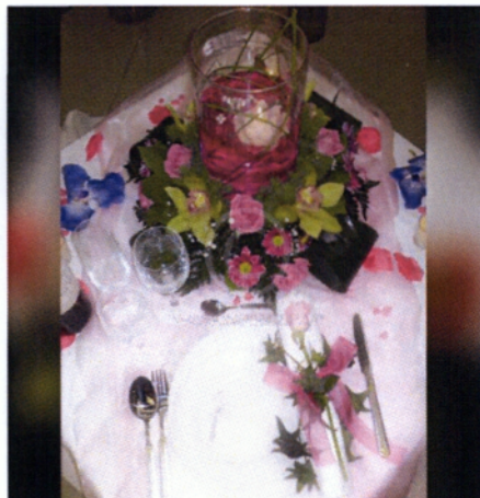
Εικόνα 3.40 Στολισμός τραπεζιού καλεσμένων

Διακόσμηση γαμήλιας τούρτας: Σύμφωνα με τις παραδόσεις το ζευγάρι κόβει την τούρτα και θα μοιραστεί το πρώτο κομμάτι αμέσως μετά την είσοδό του στο χώρο της δεξίωσης. Η διακόσμηση και το στυλ πρέπει να προσθέτουν μία ακόμη πινελιά στο σκηνικό του γάμου. Ωστόσο η κατασκευή που θα τοποθετηθεί θα πρέπει να είναι διακριτική και να μην επισκιάζει την παρουσία της τούρτας η οποία στην περίπτωση αυτή πρωταγωνιστεί.