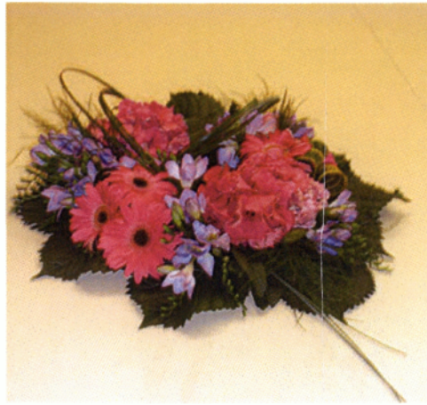
Εικόνα 6.3 Σύνθεση structural

❖ Group (ομαδοποιημένη): Η τεχνική αυτή ονομάζεται ομαδοποιημένη επειδή τα λουλούδια που χρησιμοποιούνται είναι αποκλειστικά σε ομάδες. Σε αυτή την τεχνική δίνεται ιδιαίτερη έμφαση στο σχήμα και το χρώμα των λουλουδιών.