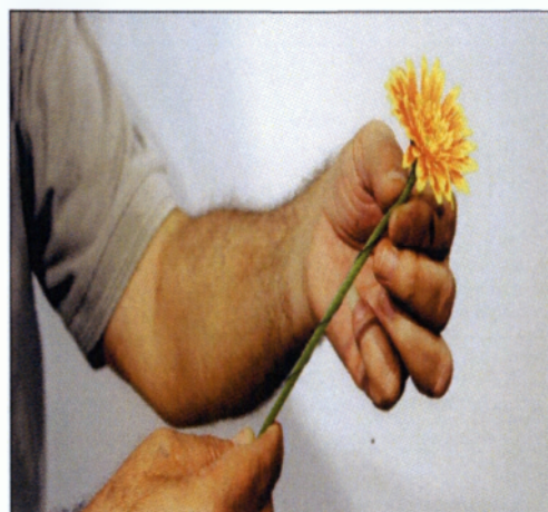
Εικόνα 2.12 Ενσυρμάτωση ξέρμπερας