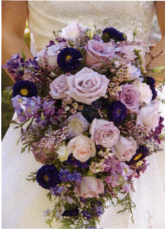
Εικόνα 3.23 Ανθοδέσμη σε ελεύθερο σχήμα σταγόνας