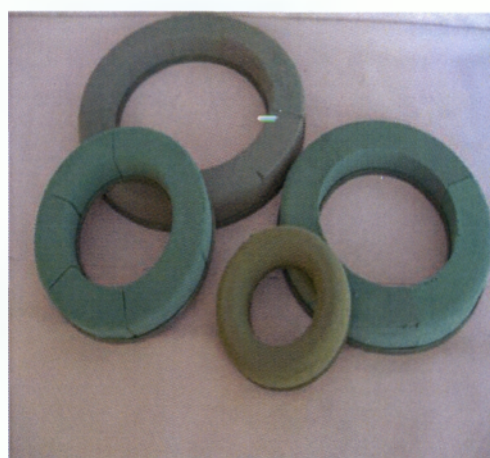
Εικόνα 2.7 Σφουγγάρια για λαμπάδες