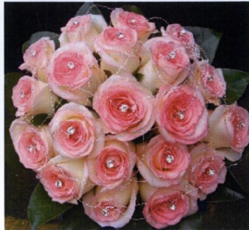
Εικόνα 3.16 Στρογγυλό-Συμμετρικό μπουκέτο