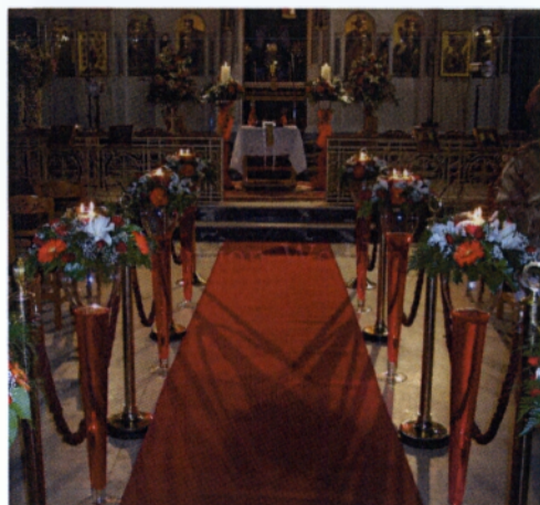
Εικόνα 3.3 Κολωνάκια με κεριά

διαχωριστικά του διαδρόμου ή μπουκέτα δεμένα πάνω σε αυτά, κυκλικά κολωνάκια ή μακρόστενα, οβάλ με κεριά στο κέντρο ή ακόμα και κρεμαστές συνθέσεις. Όποιον τρόπο και να επιλέξει κανείς σίγουρα θα πρέπει να είναι εναρμονισμένος με το σύνολο. Τα κολωνάκια πρέπει να τοποθετούνται διακριτικά ώστε να μην εμποδίζουν τους προσκαλεσμένους και να μην προκαλέσουν μικροατυχήματα. Πρέπει επίσης να είναι τοποθετημένες με τέτοιο τρόπο ώστε να παρατηρούνται περιμετρικά. Συνήθως το εσωτερικό των εκκλησιών είναι συμμετρικά κατασκευασμένο, με ίσες αποστάσεις από το κέντρο της εκκλησίας και η μία πλευρά είναι πανομοιότυπη της άλλης, γι' αυτό οι κατασκευές πρέπει να είναι και αυτές συμμετρικές. Ωστόσο μπορεί να παραβιαστεί ο κανόνας με ασύμμετρες συνθέσεις οι οποίες μπορούν να γίνουν συμμετρικές μεταξύ τους ανά ζευγάρια. Κατασκευαστικά είναι πιο εύκολα τα κολωνάκια γιατί όπως προαναφέραμε είναι πιο μικρά. Φτιάχνονται και αυτά πάνω σε ειδικά πλαστικά πατάκια και τοποθετούνται σε κέρινες βάσεις ή plexiglass ύψους μισού μέτρου τα οποία και αυτά διακοσμούνται με διάφορα αξεσουάρ και υφάσματα όπως και οι ανθοστήλες.