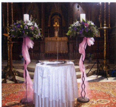
Εικόνα 3.7 Λαμπάδες γάμων