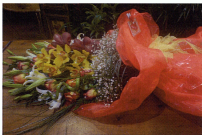
Εικόνα 5.3 Ανθοδέσμη

Αρχικά, τοποθετούνται τρία φύλλα φτέρης βάζοντας το μακρύτερο στο κέντρο και τα άλλα δύο δεξιά και αριστερά. Σε αυτό το κεντρικό φύλλο φτέρης και λίγο πιο κάτω τοποθετείται το μεγαλύτερο και εντυπωσιακότερο άνθος για να δοθεί όγκος και έμφαση. Δεξιά και αριστερά του κεντρικού άνθους τοποθετούνται λίγο μικρότερα σε όγκο άνθη. Στη συνέχεια αφού έχουν τοποθετηθεί οι πιο μακριοί μίσχοι προσθέτονται άνθη με πιο χαμηλούς μίσχους κατά τον ίδιο τρόπο. Έπειτα λίγο πιο χαμηλά τοποθετείτε η γυσοφύλλη ή κάποιο είδος φυλλάματος για γέμισμα. Στο σημείο που διασταυρώνονται οι μίσχοι δένονται με μια κορδέλα ή ένα σύρμα και τυλίγονται για δώρο(αμπαλάζ), φυσικά δεν πρέπει να παραλειφθεί το κόψιμο από κάτω(Hillier M.,1988)