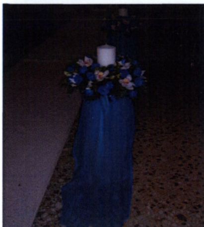
Εικόνα 4.8 Κολωνάκια βάφτισης

γίνονται με τον ίδιο τρόπο όπως έχει αναφερθεί και στο κεφάλαιο του γάμου. Τα λουλούδια και το στυλ που επιλέγονται διαμορφώνονται ανάλογα με την άποψη των ενδιαφερομένων αλλά και με το υπόλοιπο σύνολο.