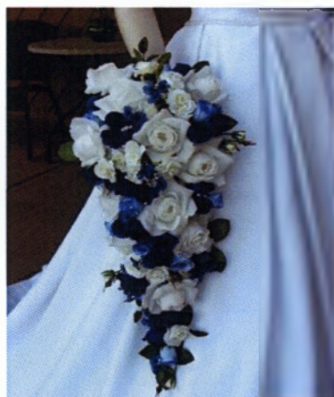
Εικόνα 3.22 Ανθοδέσμη σταγόνα