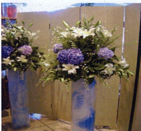
Εικόνα 3.1 Ανθοστήλες γάμων

εκκλησίας αριστερά και δεξιά , γι' αυτό πρέπει να είναι εντυπωσιακές και επιβλητικές αφού θα τις βλέπουν όλοι οι καλεσμένοι. Επίσης μπορούν να αποτελέσουν διακοσμητικό στοιχείο σε αρραβώνες, βαφτίσεις, δεξιώσεις κ.α. Υπάρχουν σε διάφορα μεγέθη και σχήματα, αλλά πάντα προσδίδουν ένα αίσθημα μεγαλοπρέπειας και αρμονίας στο χώρο όπως και να κατασκευαστούν. Μπορεί να είναι κυκλικές, τριγωνικές, οβάλ και χρησιμοποιούνται λουλούδια με μακριούς μίσχους γιατί είναι αρκετά ψηλές. Περισσότερη ομορφιά προσδίδουν και διάφορα φυλλάματα όπως το γκρας σε συνδυασμό με κάποια αξεσουάρ. Κατασκευάζονται σε ειδικά πλαστικά πιάτα και τοποθετούνται συνήθως πάνω σε βάσεις plexiglass στις οποίες μπορούν να τοποθετηθούν διάφορα αξεσουάρ, όπως χρωματιστό ζελέ, πέτρες αν ταιριάζουν με το σύνολο, χειροποίητα πλέγματα από φυσικά λουλούδια ή διακοσμημένες με διάφορα υφάσματα συνδυασμένα κατάλληλα για ένα εντυπωσιακό αποτέλεσμα. Οι ανθοστήλες συνήθως συνοδεύουν και τη διακόσμηση του κέντρου μετά τη λήξη της τελετής.