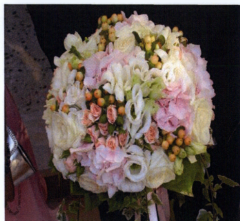
Εικόνα 3.13 Νυφικό μπουκέτο με τριαντάφυλλα Εικόνα 3.14 Νυφικό μπουκέτο με διάφορα