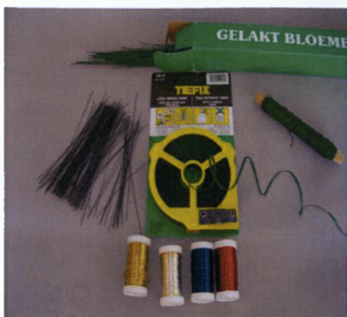
Εικόνα 2.1 Σύρματα ανθοδετικής