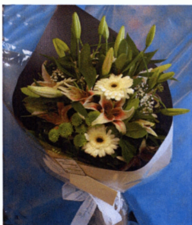
Εικόνα 5.1 Ανθοδέσμη

Οι ανθοδέσμες για να κατασκευαστούν πρέπει πάντα να είναι τοποθετημένες πάνω στον πάγκο εργασίας ώστε να επιβλέπεται το σχήμα που πρέπει να πάρει. Το απαραίτητο στοιχείο στις ανθοδέσμες είναι η βάση, δηλαδή τα βοηθητικά φύλλα που χρησιμοποιούνται για να δημιουργηθεί το σχήμα. Η ανθοδέσμη έχει σχήμα βεντάλιας και για να κατασκευαστεί αυτό γίνεται με τον εξής απλό τρόπο.