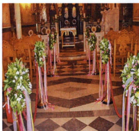
Εικόνα 3.4 Κολωνάκια με κρεμαστή σύνθεση