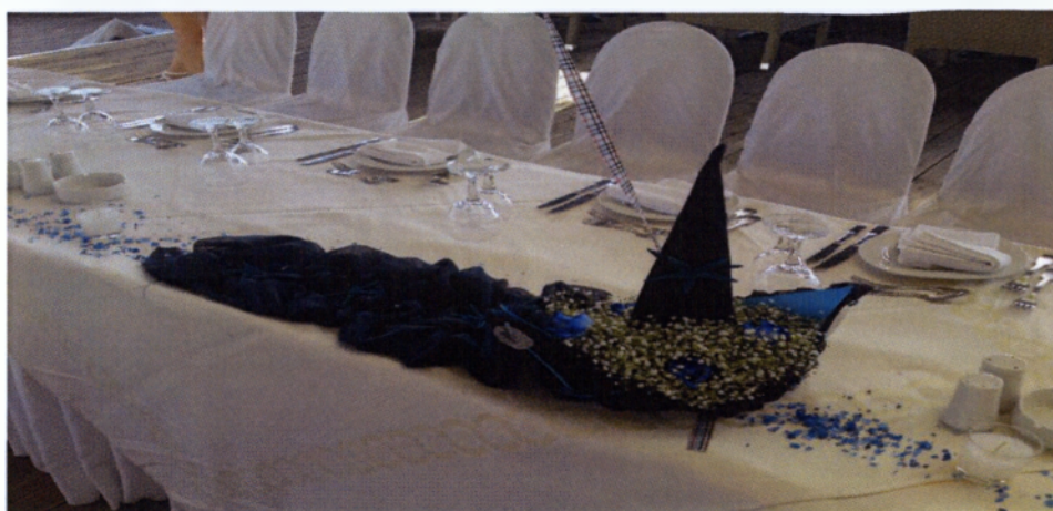
Εικόνα 4.14 Διακόσμηση τραπεζιού συγγενών

Στο τραπέζι των συγγενών δίνεται ιδιαίτερη έμφαση γι' αυτό και διακοσμείται συνήθως με τη γιρλάντα και με τις συνθέσεις που υπήρχαν στις κολώνες της εκκλησίας σε συνδυασμό πάντα με τα ανάλογα υφάσματα και αξεσουάρ.