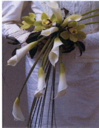
Εικόνα 3.30 Ανθοδέσμη σε ελεύθερο σχήμα

Αφού αποφασιστεί το στυλ της ανθοδέσμης πρέπει να επιλεγθεί το είδος των λουλουδιών. Τα λουλούδια έχουν βέβαια και την εποχικότητά τους, αλλά κάθε νύφη μπορεί να βρει όλα τα λουλούδια, όλο τον χρόνο. Το μόνο που θα διαφοροποιηθεί είναι η τιμή, αν τα λουλούδια δεν είναι της εποχής. Σήμερα μέχρι και χρώμα μπορεί να επιλέξει κανείς αφού οι ανθοπώλες μπορούν να το φροντίσουν. Πάντως τα πιο δημοφιλή λουλούδια για γαμήλιο μπουκέτο, είναι τα τριαντάφυλλα, οι ορτανσίες, οι ορχιδέες και οι τουλίπες. Εξίσου σημαντική όμως λεπτομέρεια είναι και η γαρνιτούρα που θα ολοκληρώσει την ανθοδέσμη. Τέτοια για παράδειγμα είναι η γυψοφύλλη και το grass που θα κάνουν τη σύνθεση πιο ελκυστική.