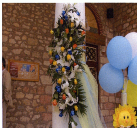
Εικόνα 4.10 Στολισμός κολώνας

Οι κολώνες είναι οι συνθέσεις που κατασκευάζονται για τοποθετηθούν πάνω στις κολώνες της εκκλησίας, όπως ακριβώς και στο στολισμό του γάμου. Ο τρόπος κατασκευής και το στυλ τους δεν διαφέρει καθόλου από όσα έχουμε αναφέρει μέχρι τώρα. Συνδυάζονται με διάφορα υφάσματα σε παλ αποχρώσεις καθώς και με κατάλληλα αξεσουάρ.