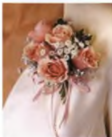
Εικόνα 3.31 Κορσάζ