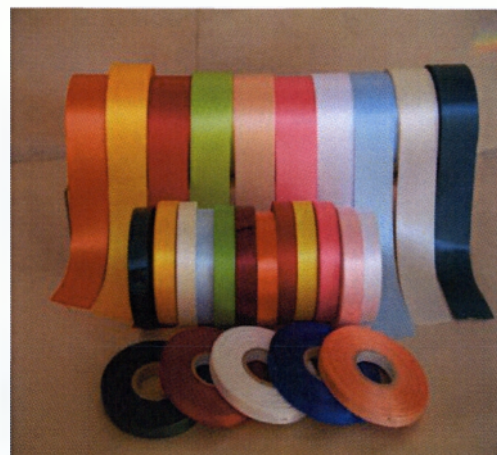
Εικόνα 2.10 Χρωματιστές κορδέλες