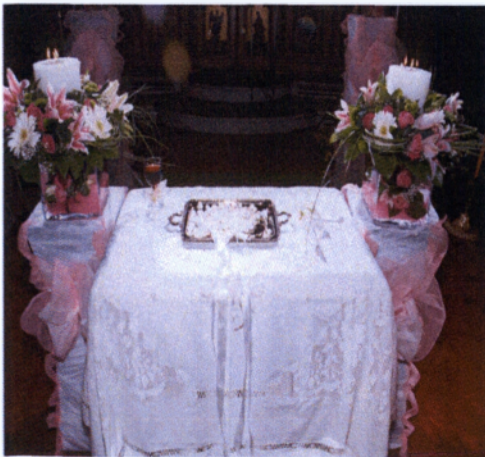
Εικόνα 3.5 Λαμπάδες γάμων

ελεύθερο σχέδιο. Ανάλογα με τον τύπο της λαμπάδας καθορίζεται και η μορφή της σύνθεσης, σε συνδυασμό πάντα και με τον υπόλοιπο στολισμό. Οι λαμπάδες που επιλέγονται μπορεί να είναι πολύ απλές και η σύνθεση που θα κατασκευαστεί θα είναι αρκετά εντυπωσιακή και γεμάτη για να καλύψει την απλότητα του κεριού. Υπάρχουν και λαμπάδες οι οποίες έχουν από μόνες τους κάποιο σχέδιο, σε αυτή την περίπτωση κατασκευάζεται κάτι πιο λιτό και απέριτο. Είναι σημαντικό τα λουλούδια να στολίζουν το κεριό και όχι το κεριό τα λουλούδια. Για την κατασκευή της λαμπάδας σε μορφή κρεμαστή χρησιμοποιούνται λουλούδια διαφόρων μηκών, αρκετά συνοδευτικά φυλλάματα και αξεσουάρ αν χρειάζεται. Δημιουργούνται πάνω σε σφουγγάρι το οποίο έχει εξωτερικά ένα πλαστικό πλέγμα και δένεται πάνω στην λαμπάδα μετά την ολοκλήρωση της σύνθεσης. Όταν έχει μορφή στεφανιού τότε χρησιμοποιούνται λουλούδια με χαμηλό μίσχο γιατί έτσι και αλλιώς σε αυτόν τον τύπο δεν δίνεται ύψος αλλά όγκος. Σε αυτήν την περίπτωση υπάρχουν ειδικά στρογγυλά σφουγγάρια σε διάφορα μεγέθη τα οποία περιτυλίγει ο ανθοδέτης με πλαστικά δίχτυα για να είναι πιο σταθερά. Μετά την ολοκλήρωση της σύνθεσης τοποθετείται πάνω στο κεριό «καρφωτά». Το ίδιο ισχύει και για οβάλ μορφή, αλλάζει μόνο το σχήμα που δεν είναι καθαρά στρογγυλό. Στην περίπτωση που επιλεγεί μακρόστενη μορφή τότε χρησιμοποιούνται λουλούδια διαφόρων μηκών για να επιτευχθεί το σχήμα και το σφουγγάρι που χρησιμοποιείται είναι το ίδιο με της κρεμαστής μορφής.