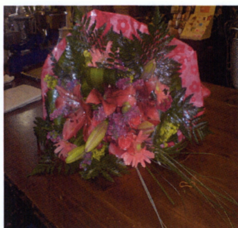
Εικόνα 5.5 Μπουκέτο