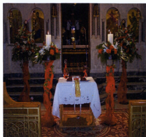
Εικόνα 3.8 Λαμπάδες γάμων