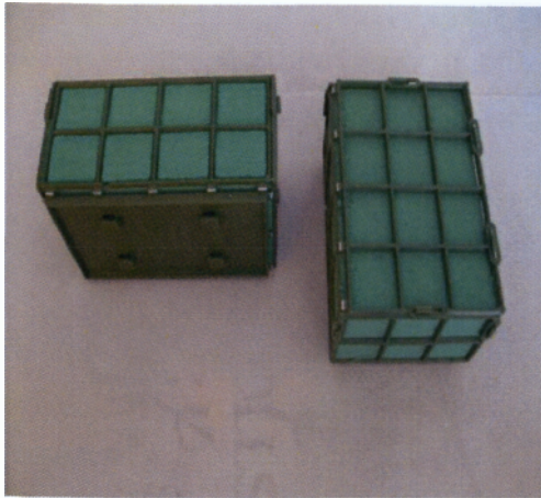
Εικόνα 2.6 Σφουγγάρια για κολώνες