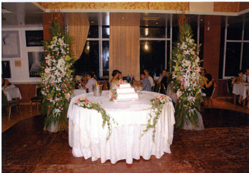
Εικόνα 3.41 Στολισμός τούρτας

Ο τρόπος που θα τοποθετηθούν τα λουλούδια είναι σημαντικός και πρέπει να εξασφαλίζεται η καθαριότητα και η υγιεινή της τούρτας. Αυτό επιτυγχάνεται με έναν πολύ απλό τρόπο, καλύπτοντας τους μίσχους με αδιάβροχο υλικό πριν καρφωθούν στην τούρτα( www.anthemion-wedding.gr )