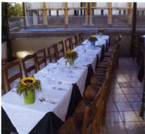
Εικόνα 4.15 Στολισμός τραπεζιών καλεσμένων

Τα τραπέζια των καλεσμένων δεν πρέπει να είναι φορτωμένα για να διευκολύνεται η οπτική επαφή και οι κινήσεις τους γι' αυτό και χρησιμοποιούνται οι συνθέσεις που υπήρχαν στα κολωνάκια σε συνδυασμό με τα φαναράκια.