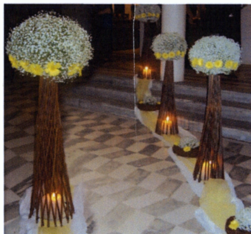
Εικόνα 4.12 Φαναράκια διαδρόμου