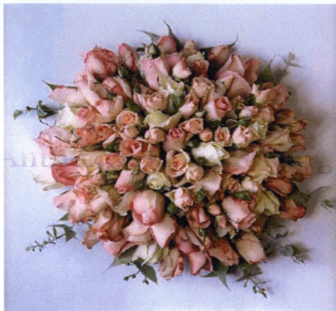
Εικόνα 3.17 Κυκλικό μπουκέτο

Συνδυασμός από διαφορετικά είδη λουλουδιών που κλιμακώνονται ρυθμικά, δημιουργώντας ένα πληθωρικό και παράλληλα χαλαρό μπουκέτο.