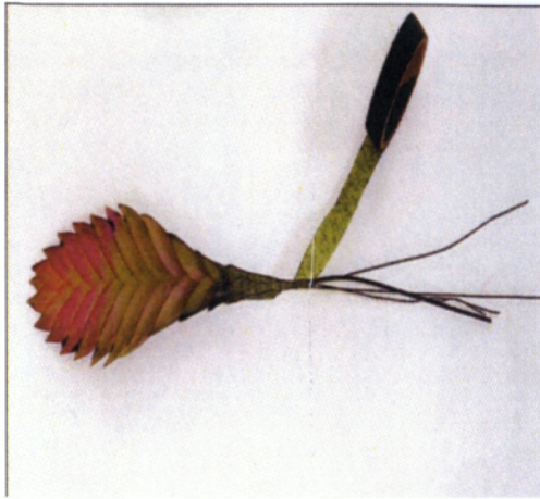
Εικόνα 2.13 Μέθοδος ενσυρμάτωσης σταυρού