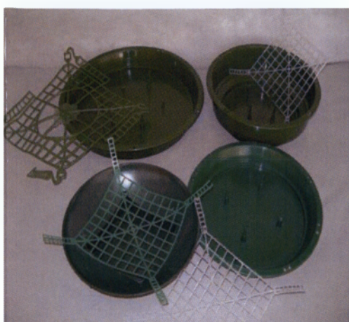
Εικόνα 2.3 Πλαστικές βάσεις