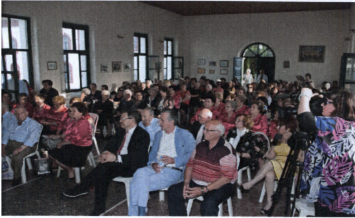
ΕΚΔΗΛΩΣΕΙΣ ΤΩΝ ΚΑΠΗ ΣΤΟ ΔΗΜΟ ΔΡΑΜΑΣ