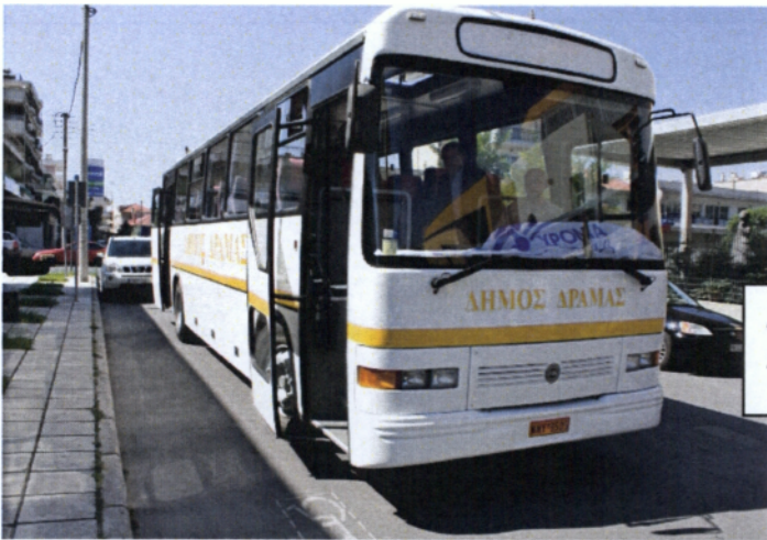
ΔΩΡΕΑ ΛΕΟΦΩΡΕΙΟΥ ΤΟΥ ΔΗΜ ΔΡΑΜΑΣ ΣΤΑ ΚΑΠΗ