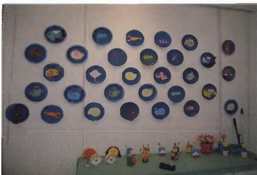
Φωτογραφία από την έκθεση ζωγραφικής που έγινε στο στούντιο 'Μελίνα' από το κέντρο ΚΛΑΠ-ΜΕΑ

Σας μεταφέρω επιπλέον τα λόγια μιας μητέρας όπως μου τα είπε: είμαι πολύ ευχαριστημένη που το παιδί μου βρίσκεται στο χώρο αυτό διότι μαθαίνει πράγματα που εγώ δεν θα μπορούσα να του μάθω. Είναι σημαντικό για μένα και την οικογένεια μου που εξυπηρετείται το παιδί μου δωρεάν στο κέντρο γιατί δεν έχω τόσα λεφτά για να πληρώνω κέντρα φροντίδας και λυπάμαι που το λέω αυτό γιατί όπως λένε όλοι οι γονείς είναι ότι χειρότερο να μην μπορείς να εξασφαλίσεις και να δώσεις στο παιδί σου αυτά που χρειάζεται. (μου ζητήθηκε από τη κυρία να μην αναφέρω το όνομα της ή το όνομα του παιδιού της)