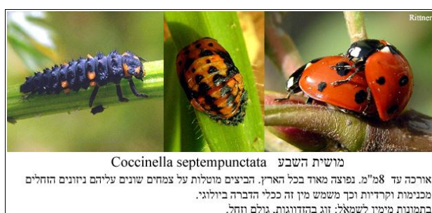
Εικόνα 6: Αριστερά προνύμφη, στη μέση νύμφη και δεξιά ενήλικα.

Ενήλικο: Το ενήλικο έντομο προβάλλει σκίζοντας το μπροστινό μέρος της νυμφικής θήκης. Χρειάζονται αρκετά λεπτά μέχρι το έντομο να αποβάλλει το νυμφικό περίβλημα. Στο στάδιο αυτό τα φτερά και τα έλυτρα είναι πολύ μαλακά και περιέχουν πολύ λίγη χρωστική ουσία. Το χρώμα των ελύτρων είναι κίτρινο ή ανοικτό πορτοκαλί. Ο χαρακτηριστικός χρωματισμός και τα σχέδια του ενηλικού αποκτούν την κανονική τους εμφάνιση σταδιακά, ανάλογα με τη θερμοκρασία. Οι περισσότερες αλλαγές συμβαίνουν μέσα στις πρώτες ώρες, όμως το κόκκινο χρώμα έχει μια ανοικτή απόχρωση για εβδομάδες ή και μήνες. Έτσι για αρκετό χρόνο είναι εύκολο να διακρίνουμε τα ενήλικα άτομα της νέας γενιάς. Μια μόνο σύζευξη είναι αρκετή για να καλύψει όλη την αναπαραγωγική ζωή των θηλυκών ατόμων των περισσότερων ειδών, παρόλα αυτά τα ενήλικα ζευγαρώνουν πολλές φορές (Σκούρας, 2009)(Εικ 6).