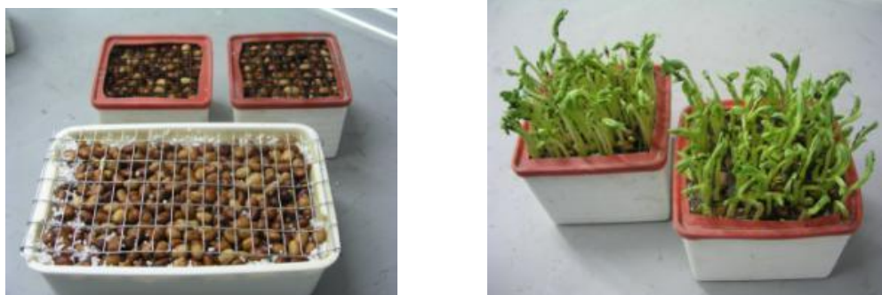
Εικόνα 10: Αριστερά, γλαστράκια με σπόρους από κουκιά πάνω σε περλίτη, δεξιά φυτρωμένοι σπόροι κουκιών έτοιμα για τεχνητή μόλυνση με A. fabae .

Από τα φυτά αυτά θα συλλεχθούν ενήλικα άτομα αφίδας, τα οποία θα είναι η τροφή των προνυμφών στο πείραμα. Επίσης, είναι τροφή και για την αποικία των ενήλικων αρπακτικών, που υπάρχουν στο εργαστήριο.