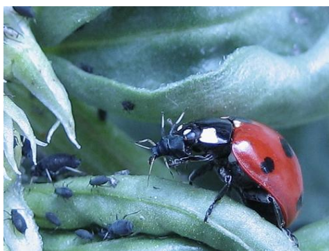
Εικόνα 7: Ενήλικο που τρέφεται με αφίδα A. fabae

Η κοκκινέλα ή πασχαλιά είναι αρπακτικό κολεόπτερο έντομο της οικογένειας Coccinellidae. Είναι αφιδοφάγο και το συναντάμε σε διάφορες καλλιέργειες, όπως καπνού και ροδακινιάς, ψυχανθών αλλά και βαμβακιού. Τρέφεται με είδη αφίδων όπως Aphis fabae (ψυχανθή), Myzus persicae (ροδακινιά και καπνό), Brevicoryne brassicae (λάχανα), A. gossypii (βαμβάκι) (Εικόνα 7).