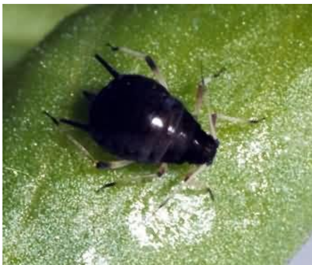
Εικόνα 2: Ενήλικο άπτερο άτομο αφίδας A. fabae

Είναι έντομα μικρού μεγέθους, δυσδιάκριτο με μαλακό αχλαδόμορφο ευαίσθητο σώμα. Το μέγεθος τους είναι μήκους 1,8-2,5 χιλιοστά και το χρώμα τους είναι μαύρο ματ έως υποπράσινο. Έχουν πόδια κοντά, με πρόσθιους μηρούς ανοικτού καστανού χρώματος και μέσους και οπίσθιους βαθιά καστανούς. Οι κνήμες είναι χρώματος υποκίτρινου με άκρο υπόφαιο και 1-2 άρθρα σε κάθε ταρσό. Οι ταρσοί είναι μαύροι. Τα κεράτια είναι κυλινδρικά, μαύρα ελαφρώς στενούμενα στο άκρο. Το σωματικό τους περίβλημα είναι ασθενώς δικτυωτό. Το ουσιώδες χαρακτηριστικό του είδους αυτού που μας επιτρέπει να το διακρίνουμε από τις υπόλοιπες μαύρες αφίδες είναι ότι η πίσω κνήμη του έμφυλου θηλυκού ατόμου είναι ισχυρότατα εξοιδημένη (Bonnemaison L, 1965). Τα στοματικά τους μόρια είναι νύσσο-μυζητικού τύπου και αποτελούνται από τέσσερις λεπτές σμήριγγες που περιβάλλονται από σωληνωτό ρύγχος. Το ρύγχος εκφύεται από τα ισχία των πρόσθιων ποδιών. Οι σμήριγγες είναι πριονωτές ώστε το έντομο να τρυπάει τους φυτικούς ιστούς (Bonnemaison L., 1965) (Εικόνα 2).